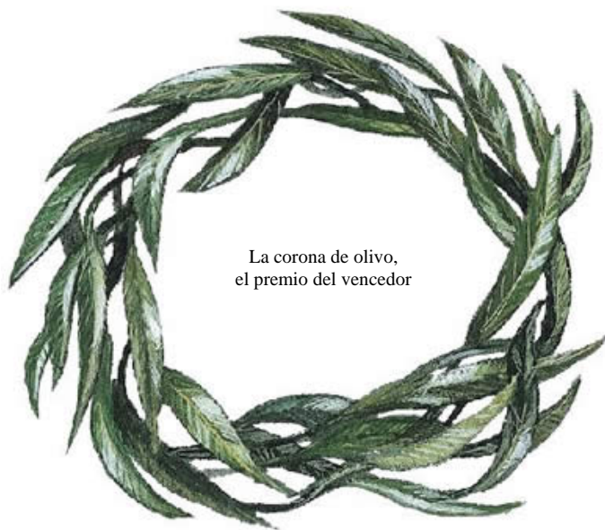
La corona de olivo, el premio del vencedor

Estos cuatro grandes festivales tenían orígenes mitológicos, en los cuáles no entraremos, eran en honor de los dioses ( Zeus en Olimpia y Nemea, Apolo en Delfos y Poseidón en Itsmia ) y durante su celebración se decretaba una tregua sagrada, por lo que guerrear mientras se celebraban los juegos era considerado sacrílego. Los premios para los atletas, que no podían ser profesionales pues se primaba el amateurismo de un modo similar al de la Inglaterra Victoriana y de principios del siglo XX, consistían no en riquezas, sino en la fama y el reconocimiento general como favorecidos por los dioses y una corona de hojas de olivo en Olimpia, una de laurel en Delfos, una de pino en Itsmia y una de vid en Nemea.