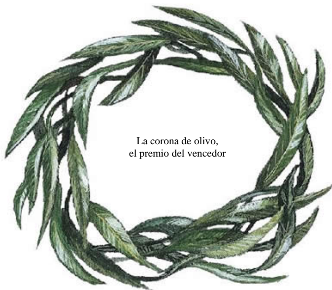
La corona de olivo, el premio del vencedor

Estos cuatro grandes festivales tenían orígenes mitológicos, en los cuáles no entraremos, eran en honor de los dioses ( Zeus en Olimpia y Nemea, Apolo en Delfos y Poseidón en Itsmia ) y durante su celebración se decretaba una tregua sagrada, por lo que guerrear mientras se celebraban los juegos era considerado sacrílego. Los premios para los atletas, que no podían ser profesionales pues se primaba el amateurismo de un modo similar al de la Inglaterra Victoriana y de principios del siglo XX, consistían no en riquezas, sino en la fama y el reconocimiento general como favorecidos por los dioses y una corona de hojas de olivo en Olimpia, una de laurel en Delfos, una de pino en Itsmia y una de vid en Nemea.