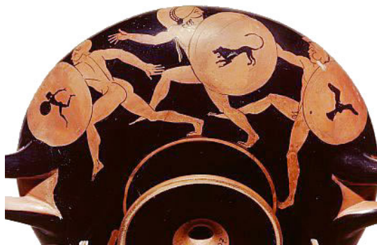
La carrera del "Hoplitón"