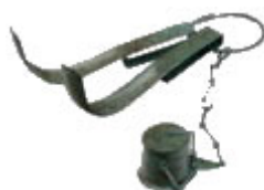
Estrigilos y aribalós

Como es sabido, los atletas competían totalmente desnudos, antes de empezar la competición se embadurnaban el cuerpo de aceite, para lo cuál cada atleta llevaba entre su equipo un recipiente de aceite llamado "aribalós", después de la competición el atleta se aseaba retirando el aceite y el polvo que se le había impregnado con una pequeña paleta curva llamada "estrígilo" y por último se limpiaba con una esponja y agua.