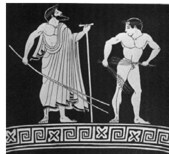
Un atleta y su entrenador

Para los antiguos griegos la práctica del deporte era fundamental para la educación de los jóvenes, no sólo de lo varones, sino también, en algunas ciudades como Esparta, también de las mujeres. Era también una forma de prepararse para la guerra, de expresar su religiosidad, ya que las celebraciones deportivas solían tener un origen mítico y venían acompañadas de manifestaciones y festivales religiosos. Desde un punto de vista político los grandes eventos deportivos, que se celebraban anualmente en Grecia, eran una forma de incrementar el prestigio de las distintas polis además de servir de expresión de la existencia de una comunidad helénica por encima de las diferencias y conflictos entre las polis en que se dividía el mundo griego y contrapuesta al mundo no griego, es decir los “bárbaros” o no griegos. Eran, como no, un modo de alcanzar el ideal griego de la perfección física, no en vano las palestras de los gimnasios eran frecuentadas por artistas, pintores y escultores en busca de modelos para sus obras.