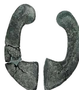
Halteras para el salto de longitud.

Pero se practicaban otros deportes en Grecia aparte de las disciplinas olímpicas, uno de los más populares fue el "episkyros" un juego de pelota del que no se conocen las reglas exactas, pero que creemos que se jugaba entre equipos de igual número de jugadores, se dividía el campo en dos quedando cada equipo en uno de los lados y las líneas de fondo eran la línea de marca. La pelota, que era relativamente pequeña y dura hecha de cuero relleno de crin, se dejaba en la línea central y el equipo que primero se hiciera con ella tenía que ir pasándosela por el aire hasta hacerla pasar por la línea