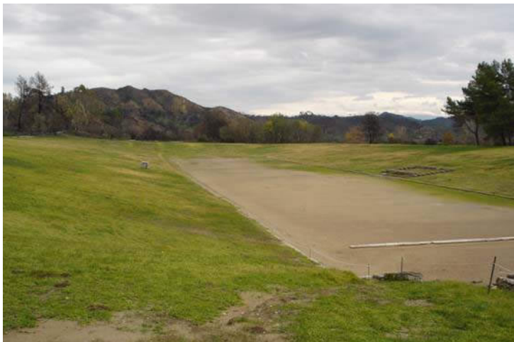
El estadio de Olimpia en la actualidad.

En el mundo griego se celebraban cuatro grandes eventos deportivos panhelénicos, los juegos olímpicos, en Olimpia, los juegos píticos, en Delfos, los juegos ístmicos, en Itsmia, y los juegos nemeos, en Nemea. De éstos los primeros en celebrarse y los más importantes, eran los juegos olímpicos, que se celebraban cada cuatro años, los juegos píticos se celebraban cada dos años, en el año anterior y posterior a los juegos olímpicos, y en los años intermedios se celebraban los juegos nemeos y los ístmicos.