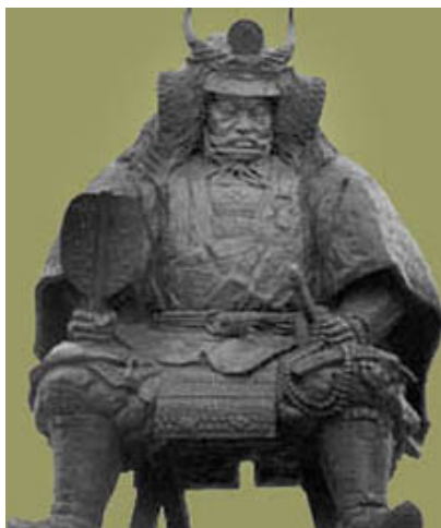
Takeda Shingen, el “Tigre de Kai”.

En 1540, Nobutora fue derrocado por su hijo Takeda Harubonu ( en 1551 Harubonu hizo los votos de monje budista, y se dio el nombre de Shingen ). A partir de ese momento, los Takeda comenzaron una expansión que les llevó a continuos enfrentamientos con sus vecinos. Con el clan de Hojo mantuvo varias guerras en un corto periodo de tiempo, y por el norte trató de apoderarse de las provincias de Norimasa-Shinano y Eichigo. En pocos años Takeda Shingen, señor de Kai, fué conocido por el merecido sobrenombre de “el tigre de Kai”.